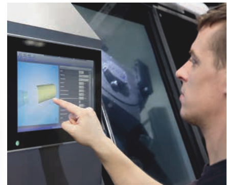
Einfache Hand- und Fernbedienung

Der zusätzliche Platzbedarf über die Maschinenmaße hinaus ist gering, da ein vorgesehener Späneförderer unter der Automation plaziert werden kann.